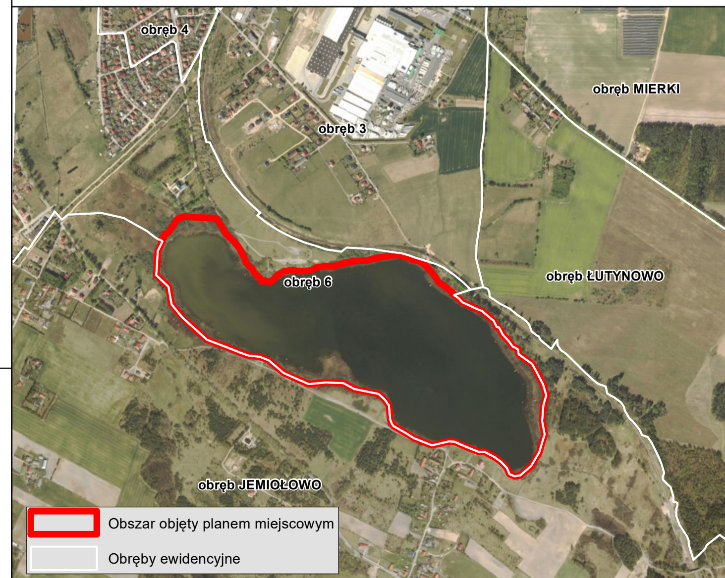
Widok poglądowy na tie ortofotomapy

Obszar objęty planem miejscowym Obreby ewidencyjne