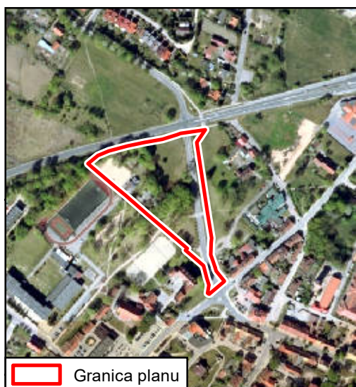
Widok poglądowy na tle ortofotomapy